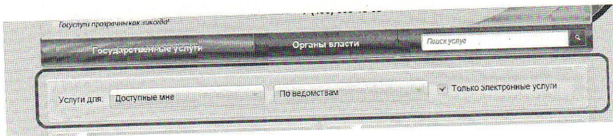
Рисунок 2. Сортировка услуг