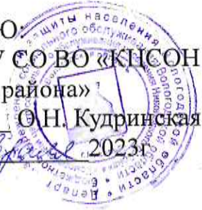
График выездов мобильной бригады на 28 февраля 2023 года